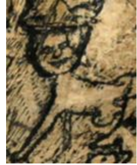
אוזיאש הופשטטר - רישום דיות - הבה נהיה שמחים

אוזיאש (ישעיהו) הופשטטר 1905-1994 עלה לישראל בשנת 1957 לאחר עשרות שנות נדודים ולא מעט סבל באירופה: פולין, אוסטריה, הולנד, גרמניה, בלגיה, צרפת, שוויצריה וחזרה לפולין. כבר בתערוכת היחיד הראשונה שלו בארץ ב-1958 נתגלה בייחודיותו האמנותית והאישית. הופשטטר הביא עימו, בנוסף על ידע מקצועי עשיר, גם עולם חוויות לא מוכר שהפליא באותנטיות שלו - המתח הנפשי של האמן, הדולה ממעמקים את שפעת הדמויות והמרקמים הנראים לכאורה לא מציאותיים אך במבט בוחן מתבררים כמשקפים את מציאות החיים והטבע דרך מבט הפנטסיה האישית של יוצרם. לכל ציור של הופשטטר ישנה משמעות אישית הנובעת מחזונו האנושי והאמנותי כאחד.